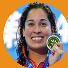
Ranomi Kromowijoyo Championne olympique