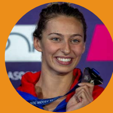
Fantine Lesaffre Championne d'Europe