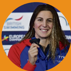
Charlotte Bonnet Championne d'Europe