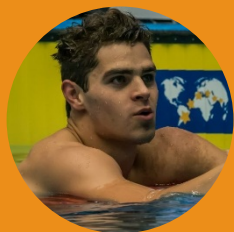
Michael Andrew Champion du monde